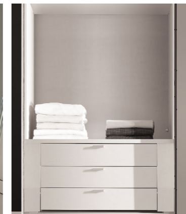
3er Schubkasteneinsatz mit Griffen, optional mit Softeinzug