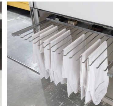
Ausziehbarer Hosenhalter breit