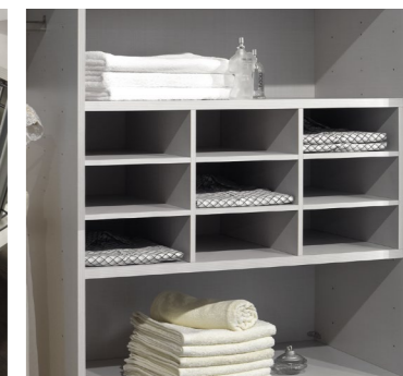
Inneneinteilung mit 9 Fächern