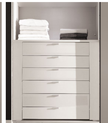
6er Schubkasteneinsatz mit Griffen, optional mit Softeinzug