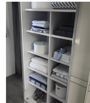
T-Einteilung mit 8 Fachböden