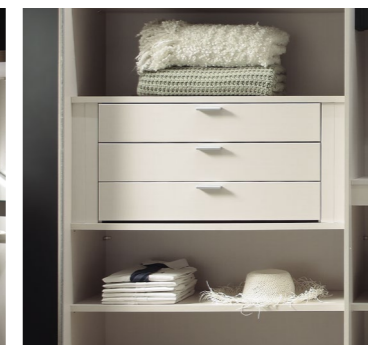
3er Hängeschubkasten mit Griffen, optional mit Softeinzug