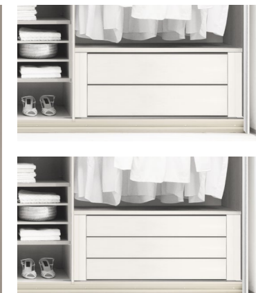
2er oder 3er Schubkasteneinsatz ohne Griffe, optional mit Softeinzug